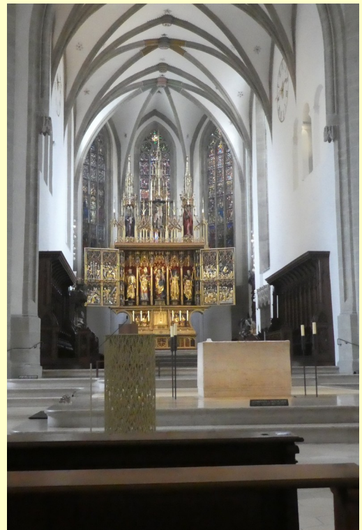
Der Dom zu Eichstätt.