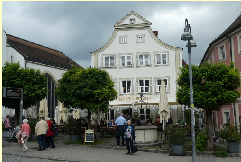
Ankunft zum Mittagessen in Eichstätt.