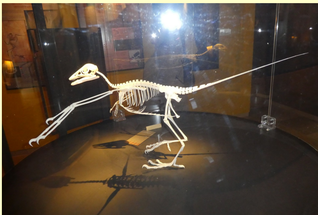
Ein Model des Urvogels Archaeopteryx.