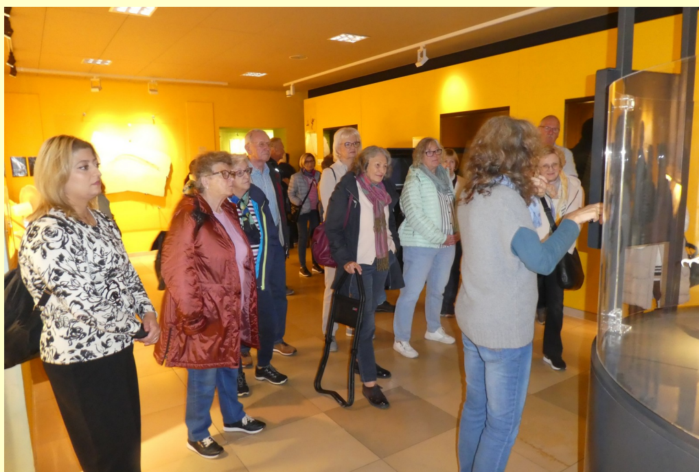
Die Führerin erläutert an einer Tafel die erdgeschichtliche Entwicklung der Erde der letzten 150 Mio. Jahre.